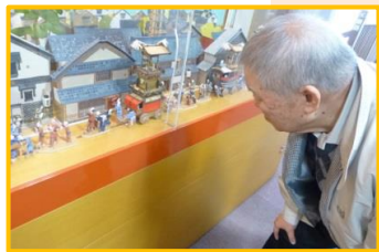
立版古と呼ばれる動くミニチュア模 型をじっくり拝見!