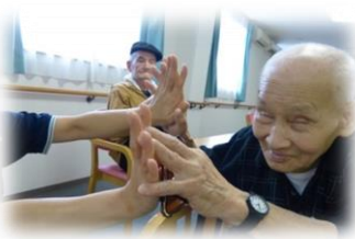
☆ふれあい☆笑顔☆音楽療法☆